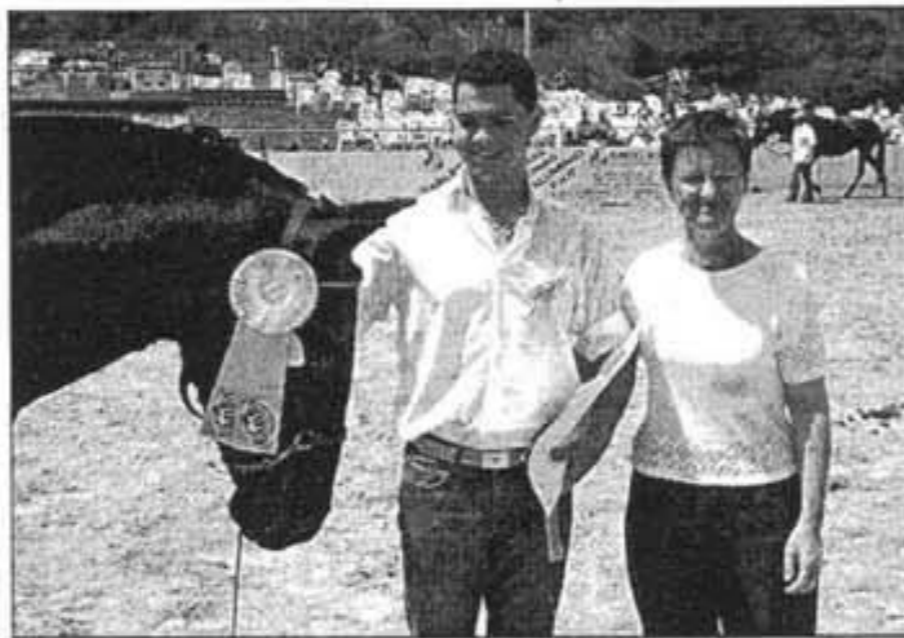
El domingo al mediodía se entregarán los trofeos.

■ Aplomos no desviados de la vertical, o la capa negra, son dos aspectos importantes