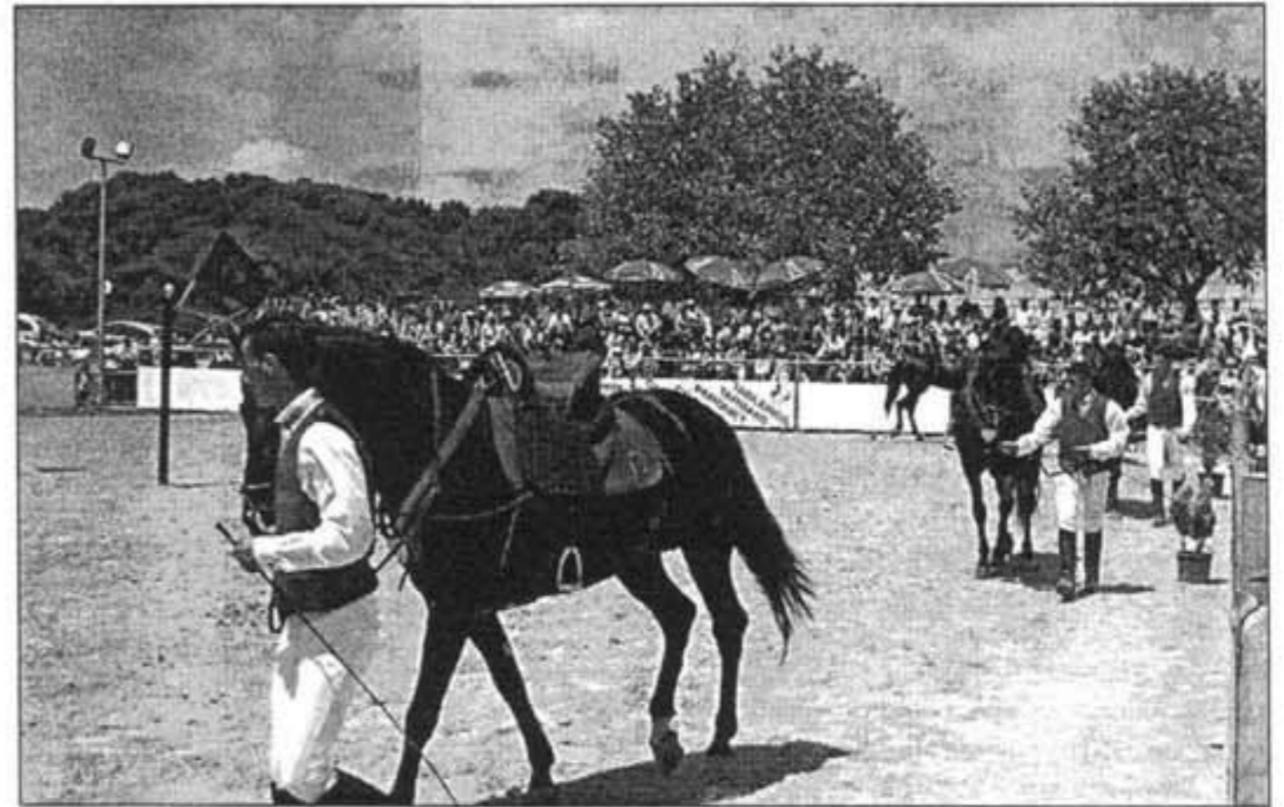
Cada año, los participantes están mejor preparados.

Más: la cruz debe estar suficientemente destacada, lo mismo que la grupa, que no debe ser demasiado caída. Los costillares de los animales tienen que ser bien curvos. Y el pecho debe satisfactoriamente