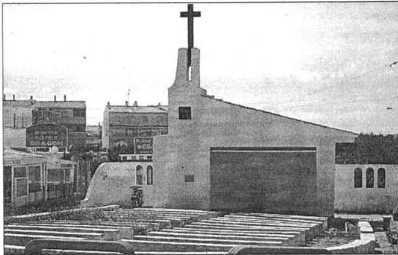
La iglesia de Los Delfines hoy día está rodeada por bares y comercios.

Este verano ya sustituirá a la veraniega de Los Delfines