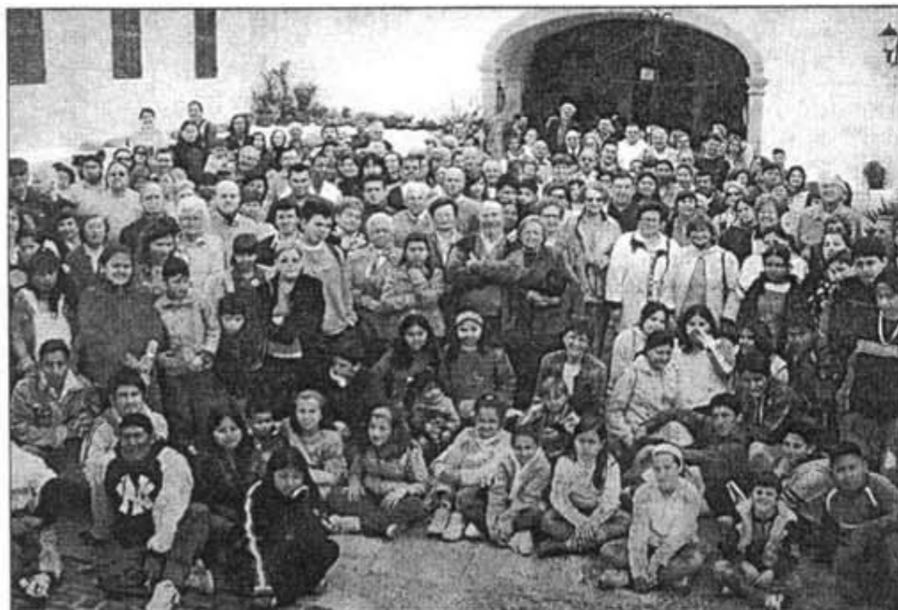
Antes del desayuno comunitario algunos fieles se reunieron para la imagen de grupo.

Después de la celebración, un numeroso grupo se reunió para hacer una foto de familia, aunque