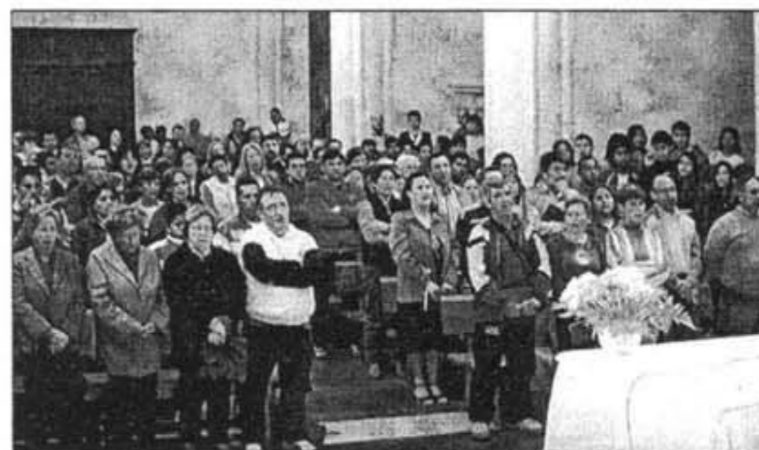
La Eucaristía pascual fue muy festiva y contó con la colaboración de varios grupos.