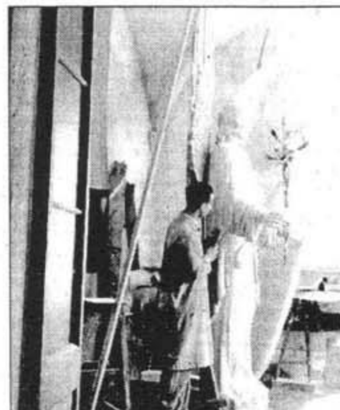
L'ÀNGEL. Al taller de l'artista, una figura que després es col·locà a la façana interior de la porta principal de la Catedral, davall de la rosassa.