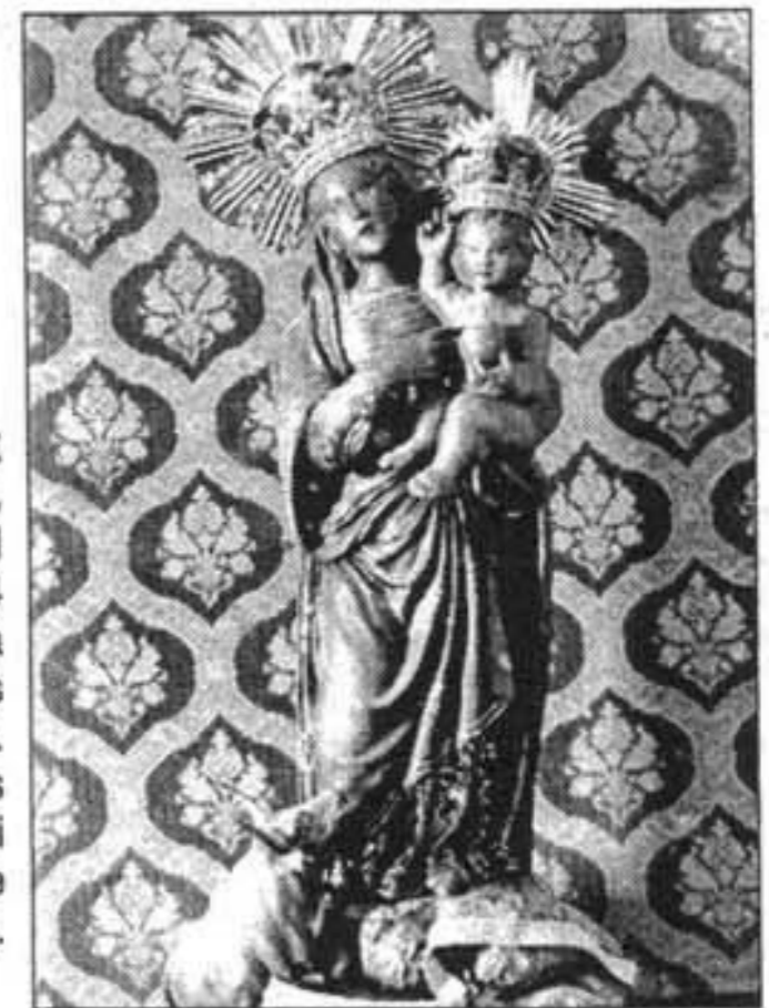
VERGE DEL TORO. Se'n van fer al voltant de 14 còpies per a diferents esglésies. L'original es troba al Santuari de la Mare de Déu del Toro.