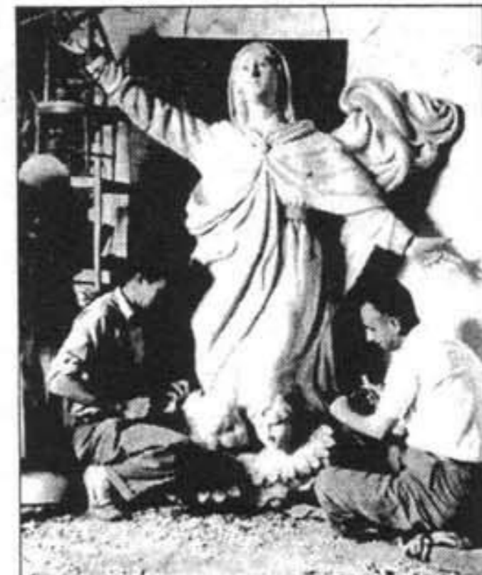
ART RELIGIÓS. Treballant en una imatge que es va destinar a la Catedral de Menorca. L'artista va escolpir un gran nombre d'obres d'art religiós.