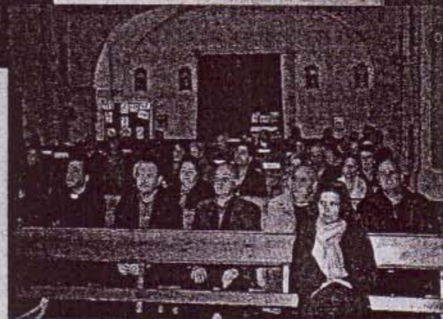
Un numeroso público presenció ayer el pregón.