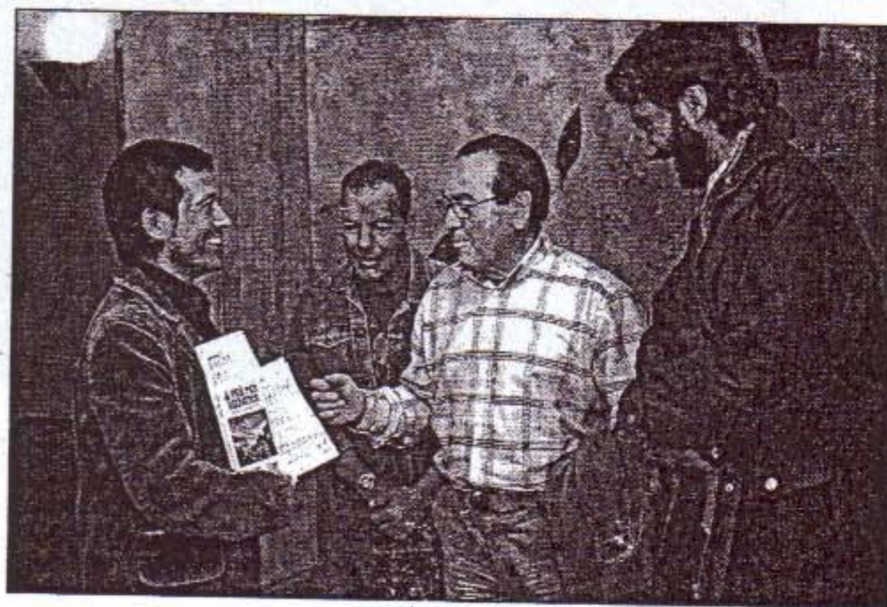
Los tres autores del libro junto con el conseller Manel Martí.

Además del recorrido, cada itinerario tiene una explicación sobre los elementos naturales e históricos que se encuentran en el camino