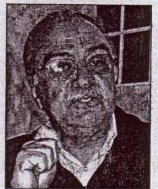
El viento trae la controversia.

Gesa proyecta su segundo parque eólico -18 MW- en Son Morell y Tecnomia promueve otros cinco. Los dos de Ciutadella y los previstos también en Alaior, Ferreries y Sant Lluís -de entre 8'5 y 11'9 MW- suman 50 MW de potencia y 50 millones de inversión. Los molinos, de 96 metros de altura, producirán la energía necesaria para abastecer a 31.000 familias y ahorrar 30.000 toneladas de CO2.