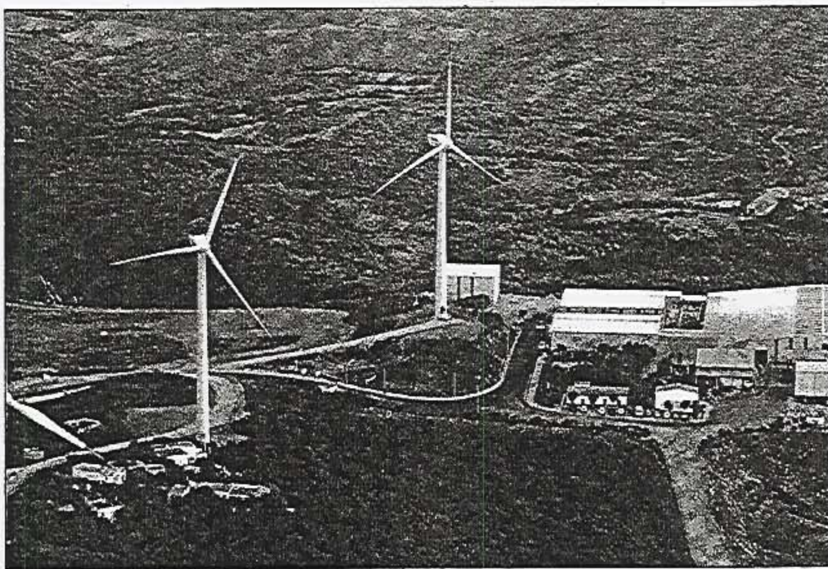
El PP de Menorca se limita a defender que los parques eólicos cumplan con todas las normativas.

En la misma línea de argumentación, Lafuente recordó ayer que cuando el Plan Sectorial de Energía de Balears estuvo expuesto al público, ni Consell de Menorca