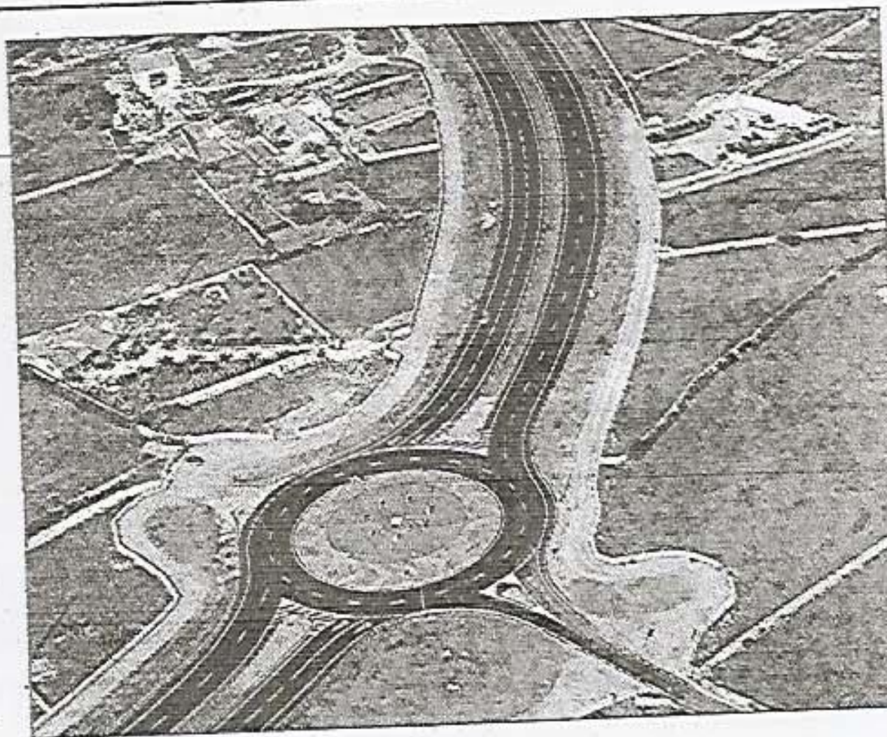
Ronda sur de Ciutadella. El PSM no está por los desdoblamientos.

El GOB, los partidos de izquierda y las asociaciones de vecinos valoran organizar movilizaciones similares a la celebrada ayer en Palma en defensa del territorio y contra los parques eólicos