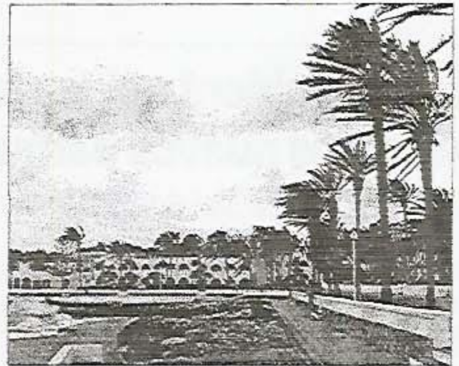
La meteorología hizo acto de presencia ayer.

La lluvia apareció durante gran parte de la mañana, dejando máximas de 67 litros por metro cuadrado en Ferreries, 55 en Llucmaçanes, 50 en Es Mercadal y 40 en Ciutadella.