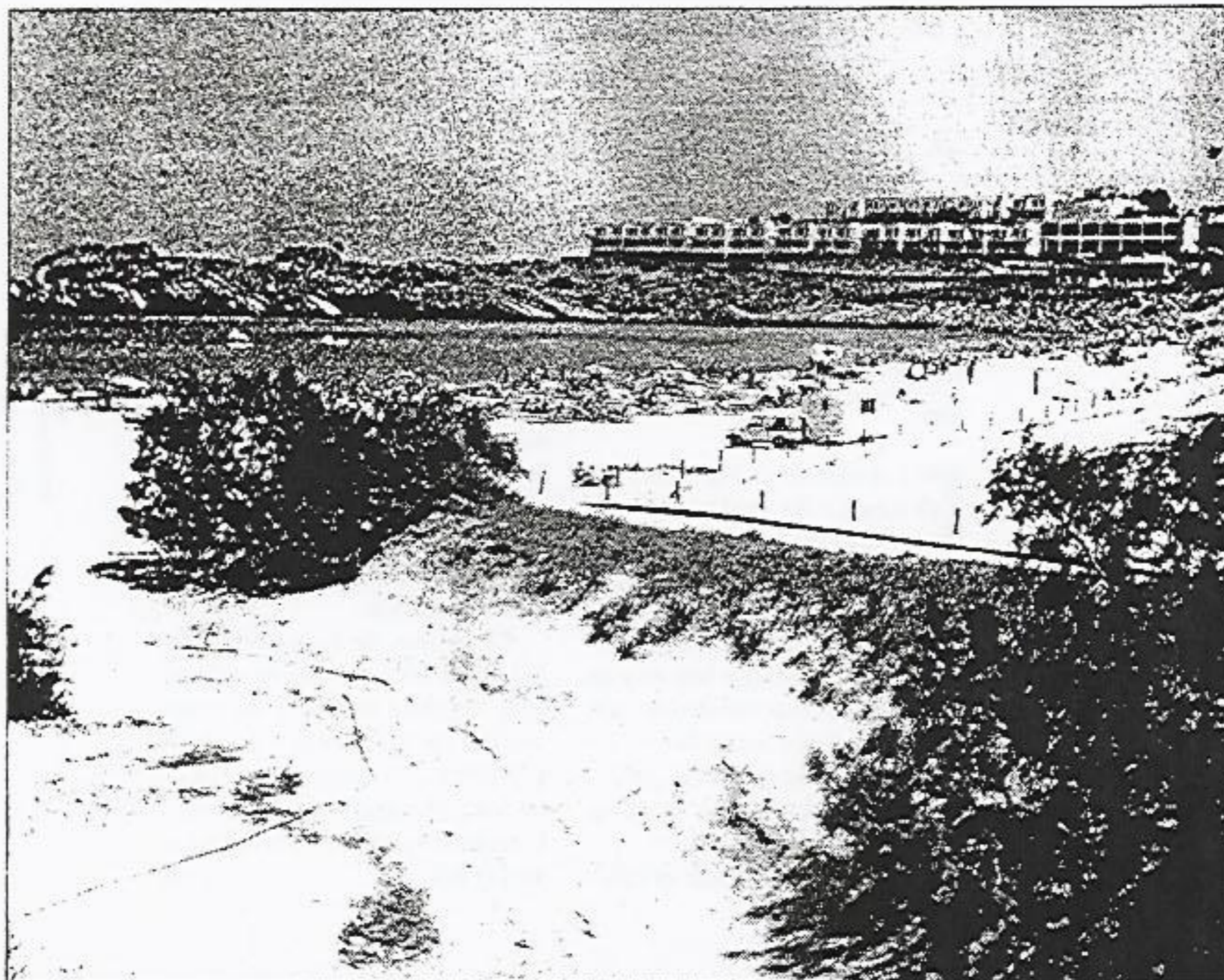
SON PARC. El Ayuntamiento acuerda un documento que permitirá la recepción parcial

La primera zona afectada se refiere a las construcciones de la isleta comprendida entre las calles Mirada del Toro, Verge del Toro y Llevant. De tal forma que las denominadas popularmente casas baratas tan solo podrán construir un primer piso más y unos metros retranqueados con la calle. Si bien, en compensación tendrán la posibilidad de construir con mayor profundidad de parcela. Asimismo, en las construcciones de la calle Llevant se reduce una planta piso, de tal forma que tan solo po-