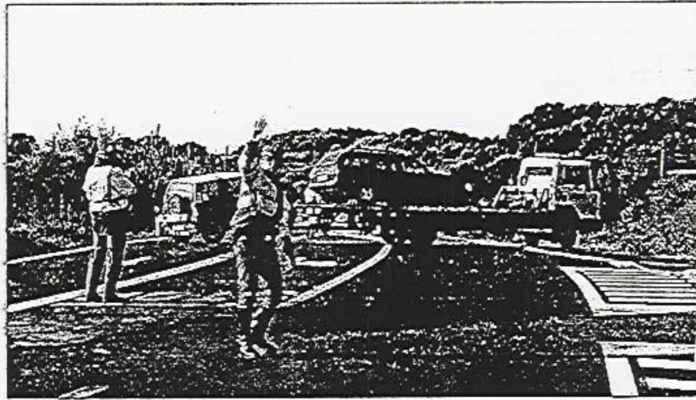
► Dos heridos graves en la carretera Maó-Fornells Un violenta colisión entre dos turismos en el cruce con la carretera de Es Grau se salda con sendos heridos de 42 y 55 años.