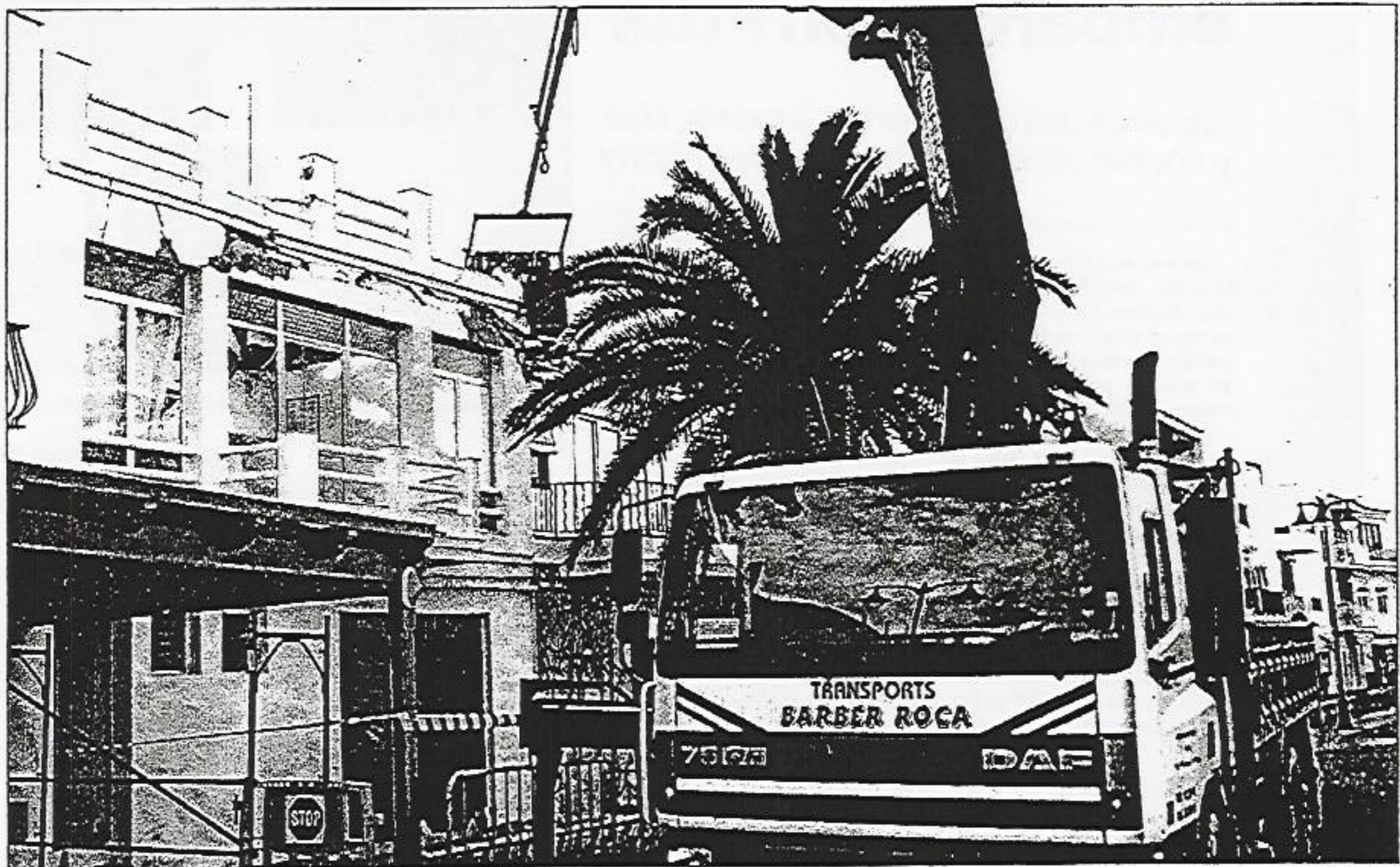
► Cae el techo de una casa en primera línea del Paseo Marítimo de Fornells. El mal estado de las vigas y la escasa solidez estructural del inmueble se apuntan como posibles causas del desplome. Por fortuna, la vivienda se hallaba deshabitada cuando sobrevino el derrumbe. En el pueblo no se habló de otra cosa.

Ultima Hora Menorca / Martes, 30 de enero de 2007