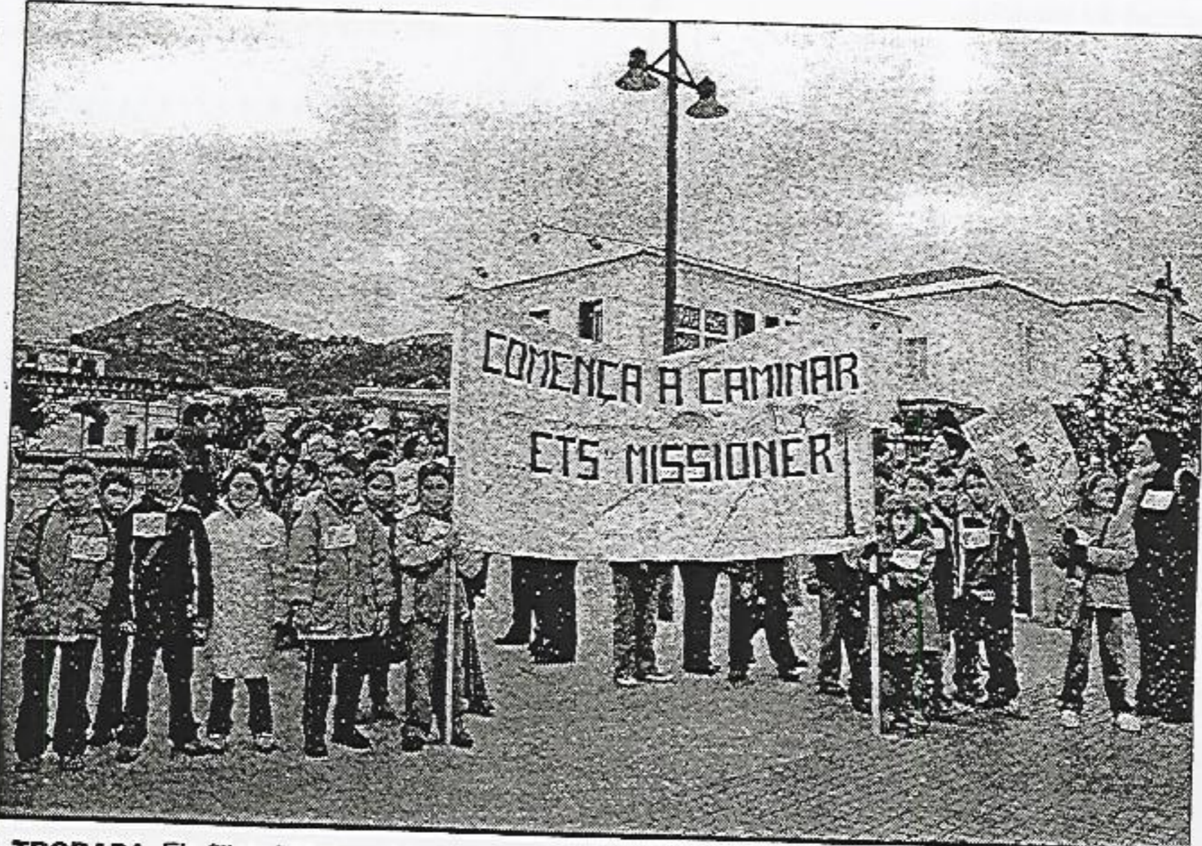
TROBADA. Els fillets i filletes ahir matí quan es van trobar a la plaça Pare Camps

A continuació, els infants que preparen la Primera Comunió es van reunir al recinte firal. L'escenari, amb la música i l'animació del grup Bufanúvols, va servir de tribuna per explicar la història de Toni i na Maria, dos personatges en què els fillets de