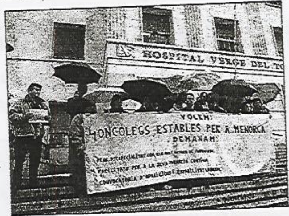
Imagen de una de las concentraciones ante el Verge del Toro.

Martes, 9 de enero de 2007 / Última Hora Menorca