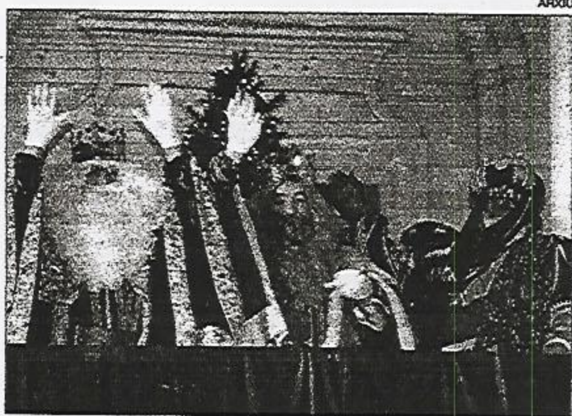
CAVALCADA. Els d'Orient arribaran carregats de regals i il·lusió

■ La sortida de la cavalcada, formada per set carrosses reials, serà des de les afores del poble. Aproximadament a les 19 hores arribaran a sa Plaça. Baixaran pel carrer Nou i es Ramal per retornar a la Plaça i dirigir-se al Centre de