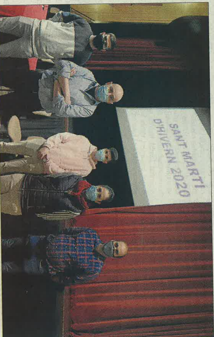
El acto de ratificación de la Junta de Caixers tuvo lugar en la Sala Multifuncional.

Durante el encuentro, siguiendo el tono de recuerdo de la exposición, también se procedió a la proyección de un vídeo con imágenes históricas de la fiesta.