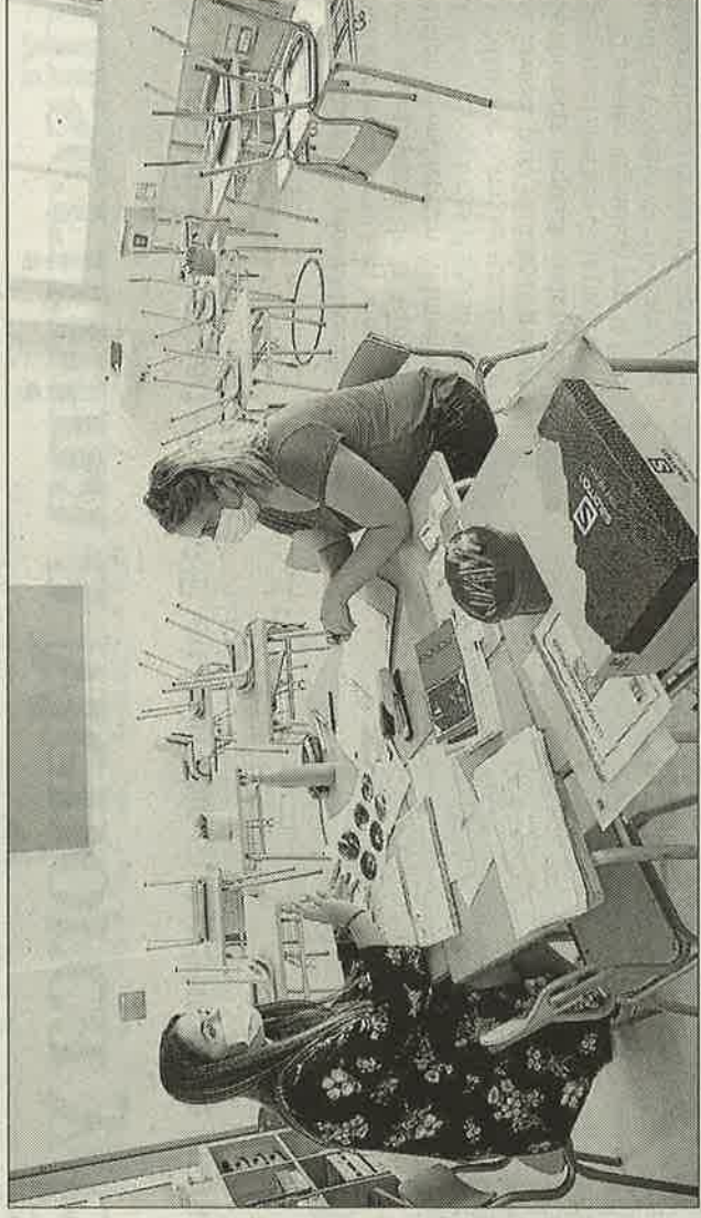
Los docentes trabajan para tenerlo todo listo cuando lleguen, de forma escalonada, los estudiantes.

sión meditada y con las máximas medidas de protección». El Consell reclamó «la máxima colaboración de todos, y que todos cumplan con sus responsabilidades», con coherencia entre las normas que se aplican en los colegios y las que las familias tienen en cuenta fuera. Ante posibles problemas como el absentismo o las dificultades sociales de algunos alumnos, se ha duplicado el volumen de educadores sociales pendientes de las aulas, que pasan de 25 a 51 en Balears.