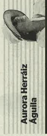
Aurora Herraiz Aguila

Teniendo en cuenta que la definición de «jóven» varía con las fluctuaciones de las circunstancias políticas, sociales y socioculturales, la ONU sitúa la juventud en la franja entre los 15 y 24 años. Con esta premisa en la actualidad hay 1.200 millones de jóvenes que constituyen el 16% de la población mundial y se estima que llegarán a 1.300 millones en 2030, año clave de los Objetivos del Milenio.