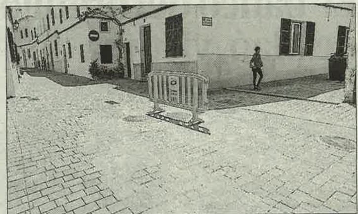
El agua filtraba hasta que el suelo cedió.

El PP ha sacado pecho al indicar que ha elaborado el plan cuando debería de haberse hecho en años anteriores. La portavoz socialista, Pilar Pons, le replica que equipos de gobierno socialistas no han elaborado planes económicos porque no existía incumplimiento y, por tanto, no era necesario.