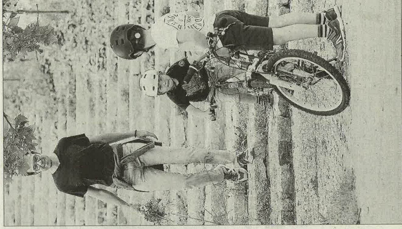
Conciencia general. La mayoría de padres cumplieron con las normas para salir a la calle con sus hijos. En la imagen, uno de ellos y los dos niños en el Passeig Marítim de Maó.

De la misma forma sucedió en el resto de municipios donde los agentes informaron a los adultos de las normas a cumplir cuando estas no se respetaban. Esta pedagogía se mantendrá, en principio, hasta mañana miércoles donde la posible reincidencia irá acompañada del levantamiento de actas que acarrearán la propuesta de sanciones mínimas de 601 euros.