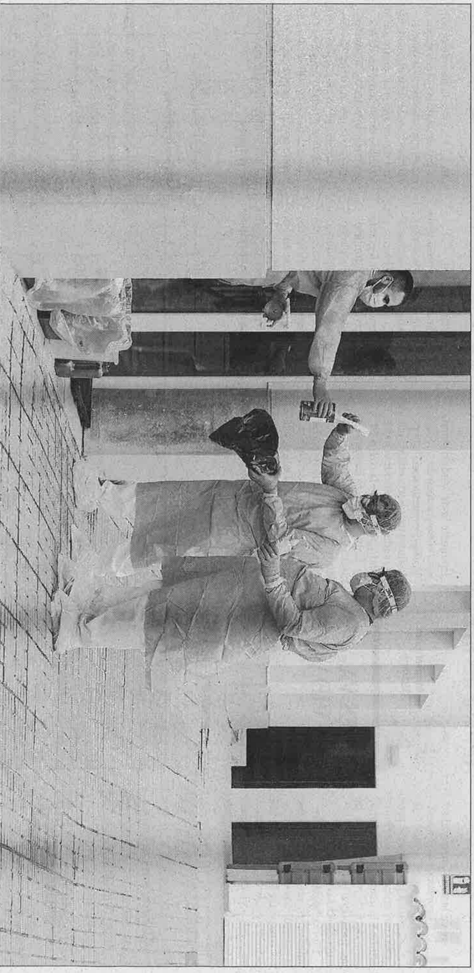
La residencia geriátrica de Es Mercadal fue ayer desinfectada para evitar contagios. En la imagen, la UVAC recoge las muestras tomadas a los residentes.