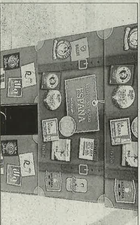
El pack conformado por las 17 cervezas, una de cada comunidad.

ha sido escogida destaca el hecho de que se trata de la primera cerveza elaborada en las Illes Balears. «La primera se vendió en julio del 2010», indica Marqués.